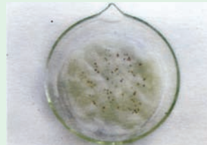
Προετοιμασία βλάστησης για τον έλεγχο συμβατότητας